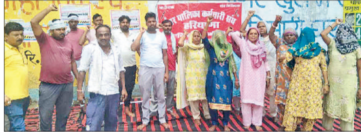
महेंद्रगढ़। नगर पालिका कार्यालय में सरकार के प्रति नारेबाजी करते सफाई कर्मचारी।

दस केंद्रीय ट्रेड यूनियनों के आह्वान कर्मचारियों, श्रमिकों और जन विरोधी नीतियों को लेकर बुधवार को हुई राष्ट्रीय व्यापी आम हड़ताल में नगर पालिका के सफाई कर्मचारी काम छोड़कर हड़ताल पर रहे। सफाई कर्मचारी के हड़ताल पर होने से शहर में जगह-जगह गंदगी देखी गई। इस दौरान कर्मचारियों ने अपनी मांगों को लेकर सरकार के प्रति जमकर नारेबाजी की। कर्मचारियों ने कहा कि काफी लंबे समय से सरकार द्वारा उनकी मांग पर ध्यान नहीं दिया जा रहा है। कर्मचारियों ने कहा कि अगर सरकार द्वारा कर्मचारियों की ओर ध्यान नहीं दिया गया तो