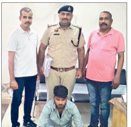
नारनौल। पुलिस गिरफ्त में आरोपित।

■ आरोपित को न्यायालय में पेश कर न्यायिक हिरासत में भेज दिया