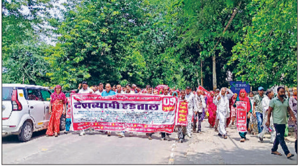
नारनौल। पुराने लघु सचिवालय पार्क में मीटिंग करते हुए। व मांगों को लेकर प्रदर्शन करते कर्मचारी संगठन।