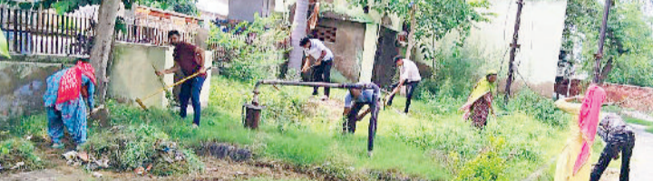
नारनौल। सघन स्वच्छता अभियान के तहत सफाई करते ग्रामीण।