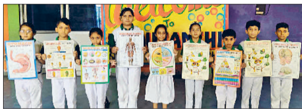
महेंद्रगढ़। बनाए हुए पोस्टर दिखाते विद्यार्थी।

हरिभूमि न्यूज। महेंद्रगढ़। यदुवंशी स्कूल में प्राइमरी विंग के विद्यार्थियों के लिए विज्ञान गतिविधियों का आयोजन किया गया। इस कार्यक्रम का उद्देश्य बच्चों में वैज्ञानिक सोच, जिज्ञासा एवं रचनात्मकता को बढ़ावा देना था। कार्यक्रम की शुरुआत विज्ञान अध्यापिका द्वारा की गई, जिन्होंने विद्यार्थियों को विज्ञान के महत्व के बारे में बताया। कार्यक्रम के दौरान छात्रों ने विभिन्न रोचक प्रयोग प्रस्तुत किए। छात्रों ने पानी में वस्तुओं के तैरने-डूबने, बल और गति, प्रकाश का परावर्तन जैसे आसान और मजेदार प्रयोग करके विज्ञान की जटिल अवधारणाओं को सरल तरीके से समझाया। विद्यार्थियों ने पूरे उत्साह और रूचि के साथ गतिविधियों में