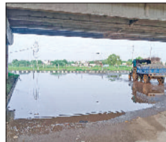
समस्या बनी हुई है।

समस्याओं पर चर्चा हुई। बूढ़वाल व नांगल नूनिया गांवों में गांव की नालियों के पानी की निकासी राष्ट्रीय राजमार्ग के निर्माण के उपरांत बंद होने की वजह से गांवों के अंडर गंदा पानी जमा होने व राष्ट्रीय राजमार्ग पर एकत्रित होने से एक गम्भीर जन